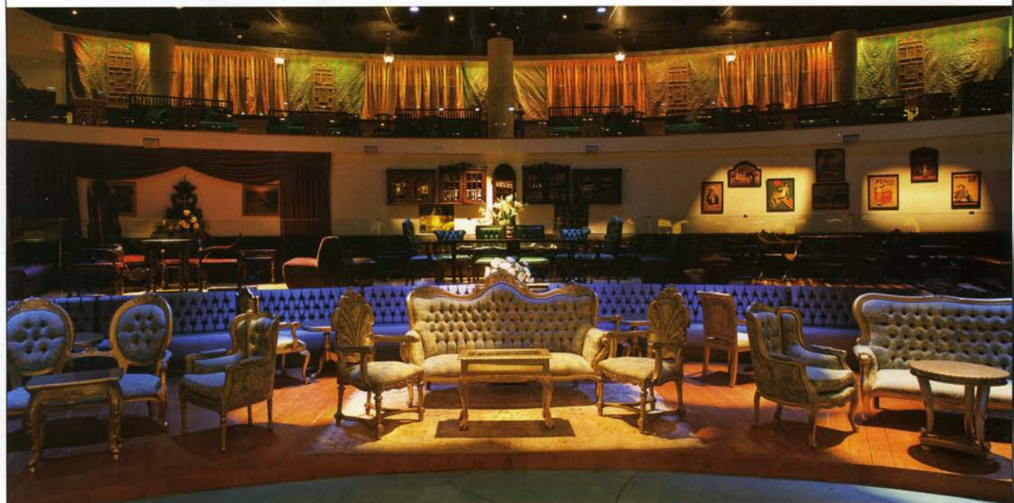
פינה באולם בסגנון וורסאי.

ערוד היא ילידת 1944, וגדלה ברמת גן. היא מעולם לא הצהירה על כוונות הנהגה, אך אמירותיה סחפו אחריה קהל מאמינים. עמדתה האוונגרדית לא תמיד התקבלה בהבנה, אבל לימים, המשהו האחר והטבעי שהיה טבוע בה הביא להקמת "העין השלישית", קבוצת אמנים, שהפיצו את אמונתם באמצעות אמנות פלסטית שהציגו בתערוכות, באמצעות כתיבה, מוזיקה וקולנוע. הם גם שהקימו את חנות הניו-איג' הראשונה בארץ. בשנות השישים הסוערות הללו חילקה דפנה את זמנה בין תל אביב לקומונות בנימינה, שם הייתה חלק מקבוצה שחיה ויצרה יחד. בשנת 1979 היא התנתקה מבנימינה וחזרה לגור ולעבוד בתל אביב. ערוד הציירת הציגה בעשרות תערוכות בארץ ובעולם, בתערוכות קבוצתיות ובתערוכות יחיד. אחד מציוריה המפורסמים, "היער הכחול", הוצג ביפו, בתל אביב ובבניין האו"ם בניו-יורק. ציור ענק, מעשה ידיה, הפרוס על פני 40 מ"ר, שכולו אריחי עץ קטנים, סייע לאסוף תרומות עבור ילדי השאנטי, מרכז תל-אביבי המטפל בילדי שוליים. כמשוררת מוערכת, חלק משיריה הולחנו ובוצעו בערב שנערך עבורה בתיאטרון הבימה ובאירועים נוספים ברחבי הארץ.